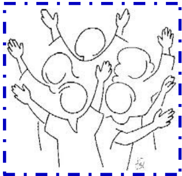
Fait spécialement pour toi